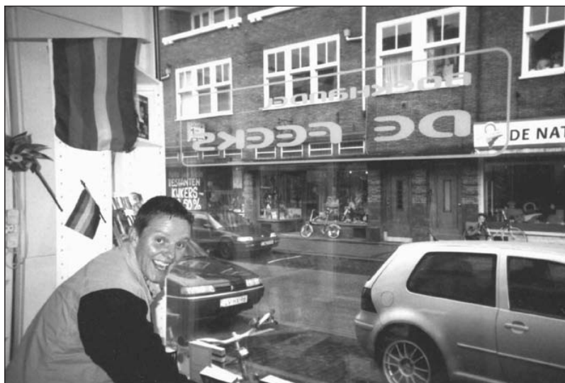
Boekhandel De Feeks is vernieuwd en biedt in deze kolom leestips voor de zomer.

Meeslepend en romantisch schetst dit boek een realistisch beeld van het leven in het Londen van tijdens en na de Tweede Wereldoorlog. Je volgt drie vrouwen en een man die veel hebben meegemaakt tijdens de Blitz en daarna moeite hebben het leven weer op te pakken. Kay bestuurde een ambulance tijdens de oorlog en zwerft nu in mannenkleden rusteloos door de straten van Londen. Slimme en lieve Helen draagt een pijnlijk geheim met zich mee. Glamour girl Viv blijft tegen beter weten in hangen aan haar getrouwde minnaar. De homoseksuele Duncan heeft in de gevangenis gezeten maar is later ook niet vrij.