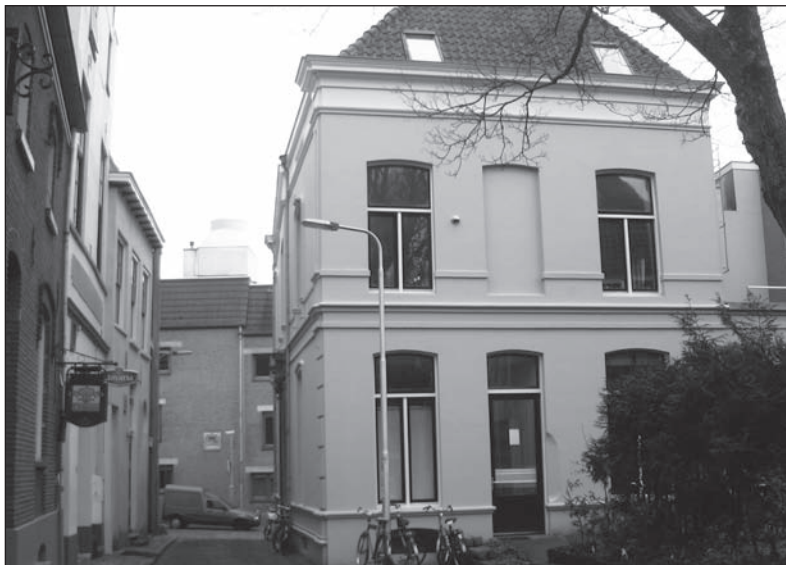
Sint Antoniusplaats nr 1 is een historisch pand. Het ligt op een steenworpafstand van De Lindenberg. Op de begane grond zou het nieuwe roze huis kunnen komen. Hoewel er nog heel wat financiën geregeld moeten worden, is het COC bestuur optimistisch gestemd.

Het COC bestuur is optimistisch gestemd over mogelijk nieuwe huisvesting aan de St. Antoniusplaats. Het straatje dat vernoemd is naar de heilige van zoekgeraakte zaken. Er zijn nog wel wat hobbels te nemen, maar mogelijk kunnen in april de verhuisdozen weer in- en uitgepakt worden. Niet alleen het COC Nijmegen kan dan verhuizen, maar ook homojongerengroep Dito! en tal van andere gebruikers. Er zal nog heel wat werk verzet moeten worden. Niet alleen qua verhuizing, maar zeker qua dagelijks beheer. PINK houdt de vinger aan de pols.